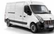
BRANCO GLACIER (CO)