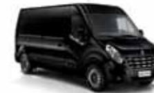
PRETO NACRÉ (PM)