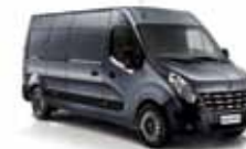
CINZA ACIER (PM)