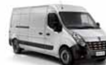
PRATA ÉTOILE (PM)