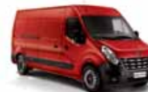
VERMELHO VIVO (CO)